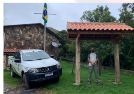
Placa de Entrada de Trilha (PET) pronta na Parte Alta.