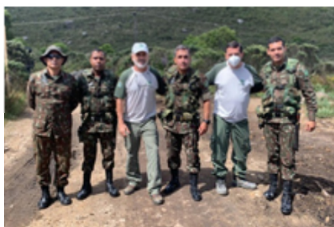
Visita da AMAN à Parte Alta em missão de REC, com a Chefia do PNI.

Uma trilha bem sinalizada, segura e com mapas é o que todo caminhante deseja. A sinalização da TMTQ está baseada em sinalização “rústica” e na sinalização através de placas e tabuletas (maiores informações no site da trilha), padronizada por manual de sinalização editado pelo ICMBio. A Transmantequeira percorre 42 KM dentro do PNI; Recebe o nome de Setor 14 - Parque Nacional do Itatiaia. Neste Setor, no Posto 03 da Parte Alta do PNI, foi instalada a Placa de Entrada de Trilha (PET) referente ao Setor 14 da TMTQ