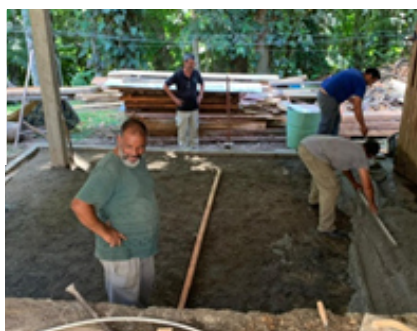
Serviço de concretagem na marcenaria, realizado com o apoio de doação de materiais da AAI.