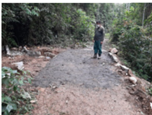
Drenagem da Trilha das Borboletas

Pretendemos proporcionar à sociedade um sistema de trilhas sustentável e diversificado, melhorando e ampliando as experiências para os usuários do Parque Nacional do Itatiaia, incluindo caminhantes, ciclistas e pessoas que precisam de acessibilidade.