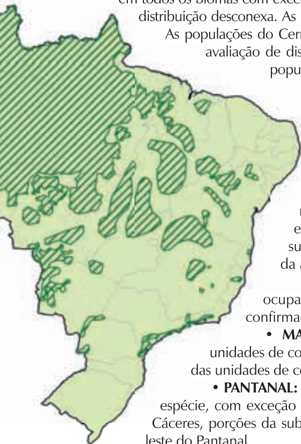
Figura 1. Distribuição atual da onça-pintada no Brasil, baseada nas áreas de ocupação das populações em cada bioma.

• PANTANAL: acredita-se que cerca de 47% (70.073 km 2 ) do bioma seja ocupado pela espécie, com exceção de quase todo o Leque Aluvial do Rio Taquari, parte da sub-região de Cáceres, porções da sub-região do Nabileque (sul de Corumbá), e áreas nas bordas nordeste e leste do Pantanal.