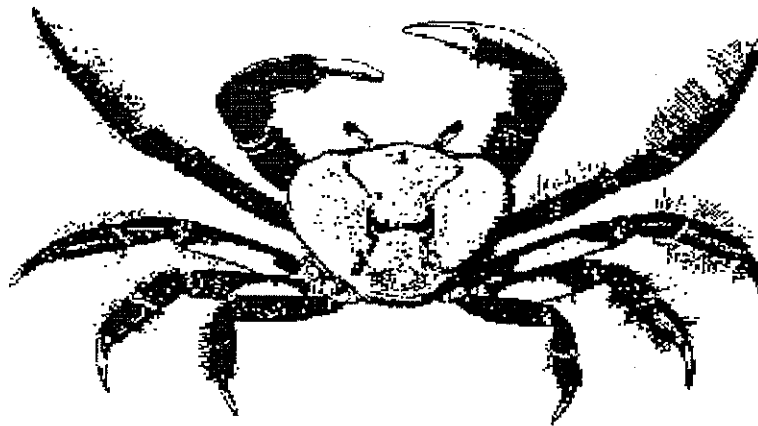
Figura 1 – Espécime do caranguejo-uçá, Ucides cordatus cordatus (Linnaeus, 1763).

O caranguejo-uçá Ucides cordatus cordatus (Linnaeus, 1763) (Figura 1) é um importante elemento em toda sua área de ocorrência nas regiões de mangue do Brasil, entre os estados do Amapá e de Santa Catarina. Esta espécie assume características de recurso pesqueiro de elevado valor socioeconômico no Nordeste do Brasil, contribuindo para a geração de emprego e renda nas comunidades pesqueiras que vivem nas zonas de estuário onde a pesca apresenta aspectos muito primitivos. O caranguejo-uçá alcança altos valores de comercialização nas grandes cidades, em função da sua elevada procura pelos turistas. Além do Brasil, a espécie apresenta importância econômica apenas no Suriname e na República Dominicana (Nascimento, 1993).