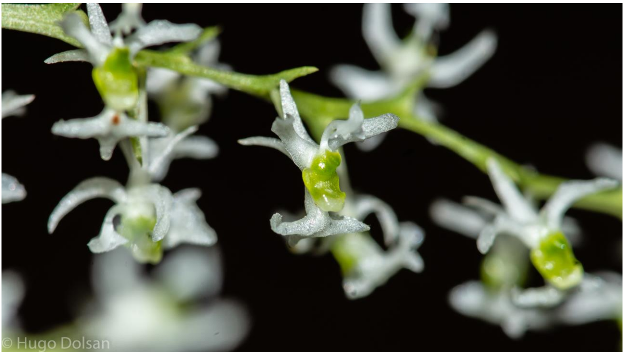
Micro orquídea Phymatidium cf hysternanthum

Devido ao clima chuvoso, não foi possível fazer mais de uma ida ao parque no período solicitado, sendo a única ida dedicada à coleta do espécime, e à procura de mais populações floridas no entorno.