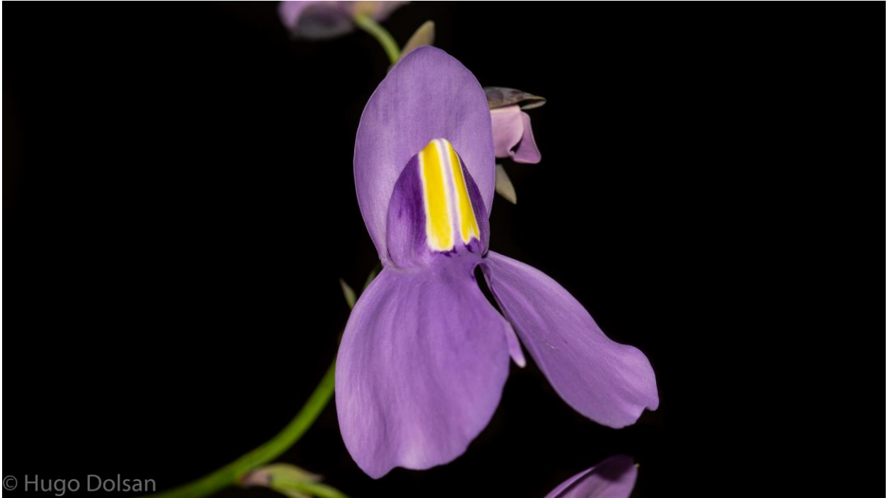
U reniformis flor.