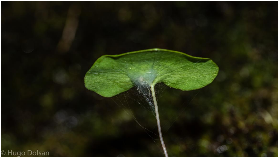
U. reniformis Parte carnívora (utrículo)