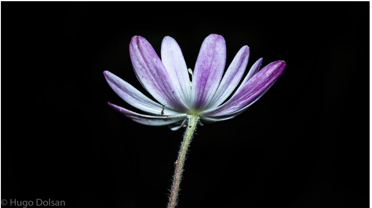
Ranunculaceae- Anemone cf sellowii