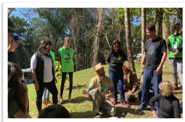
Figuras 1 e 2: Atividades realizadas no dia 21 de julho – #UmDiaNoParque

O Programa de voluntariado do PNI recebeu, em imersão de 8 dias, no período de 18 a 25 de julho, 8 voluntários de regiões diferentes do Brasil, para atuarem nas linhas temáticas de Uso Público & Negócios e Gestão Socioambiental, onde após a capacitação com servidores do PNI, os voluntários atuaram frente aos visitantes no período de férias.