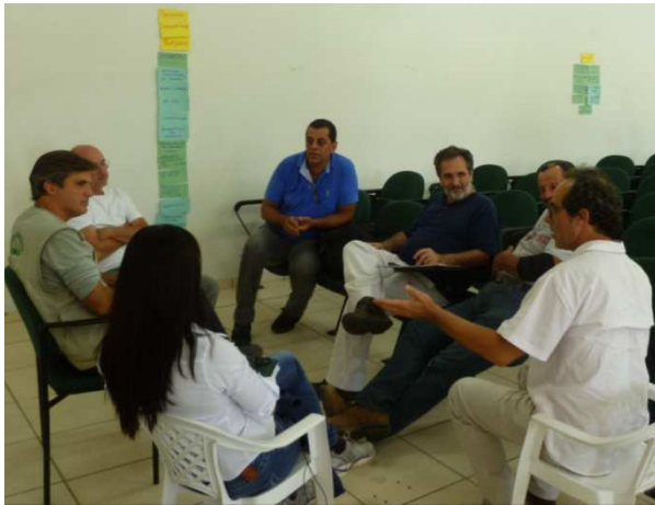
Foto 9: Participantes do grupo de Turismo, Infraestrutura e Parcerias.