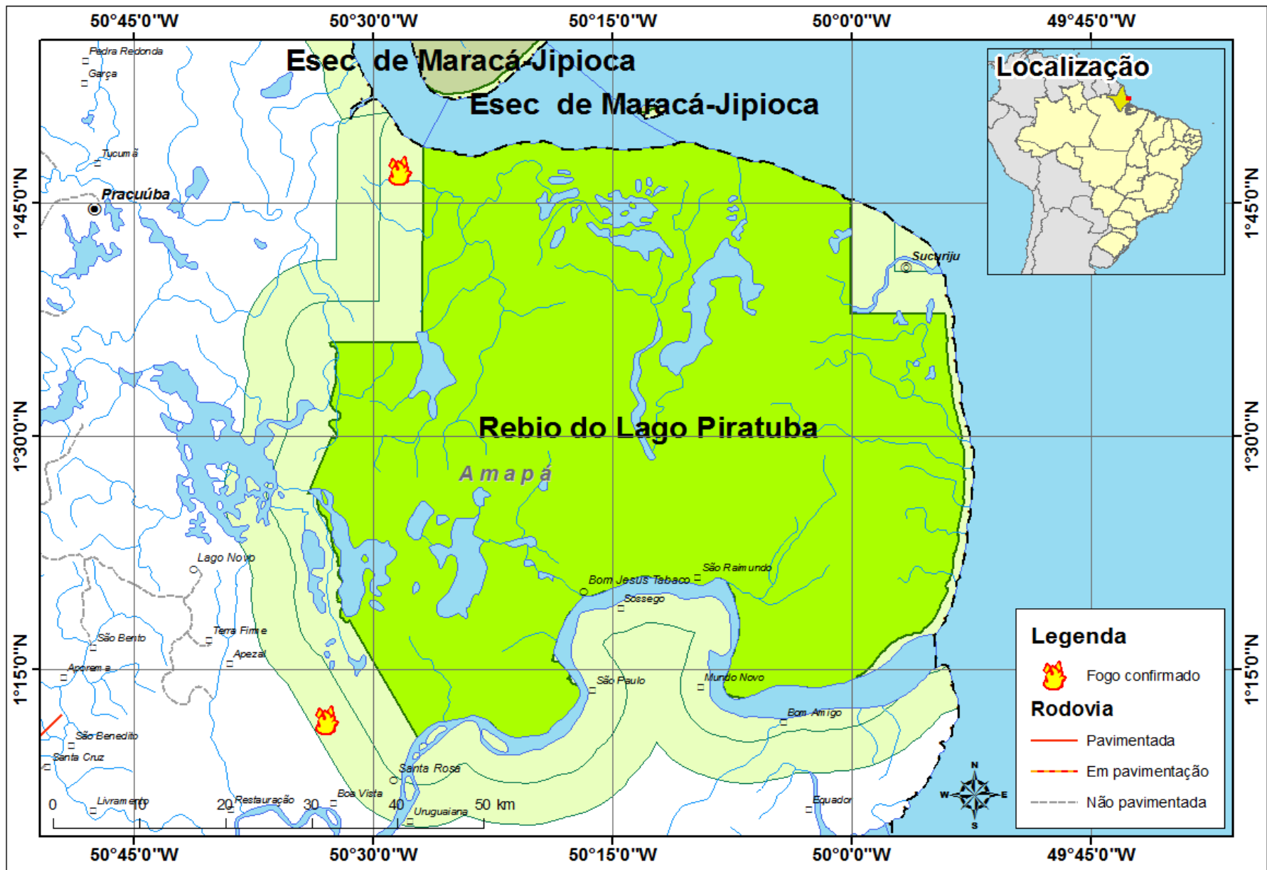
Figura 2: Localização dos incêndios confirmados na REBIO do Lago Piratuba.