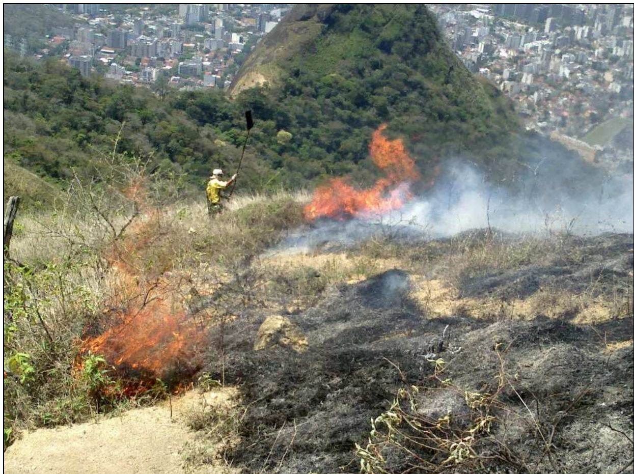
Figura 2: Combate no Parque Nacional da Tijuca.